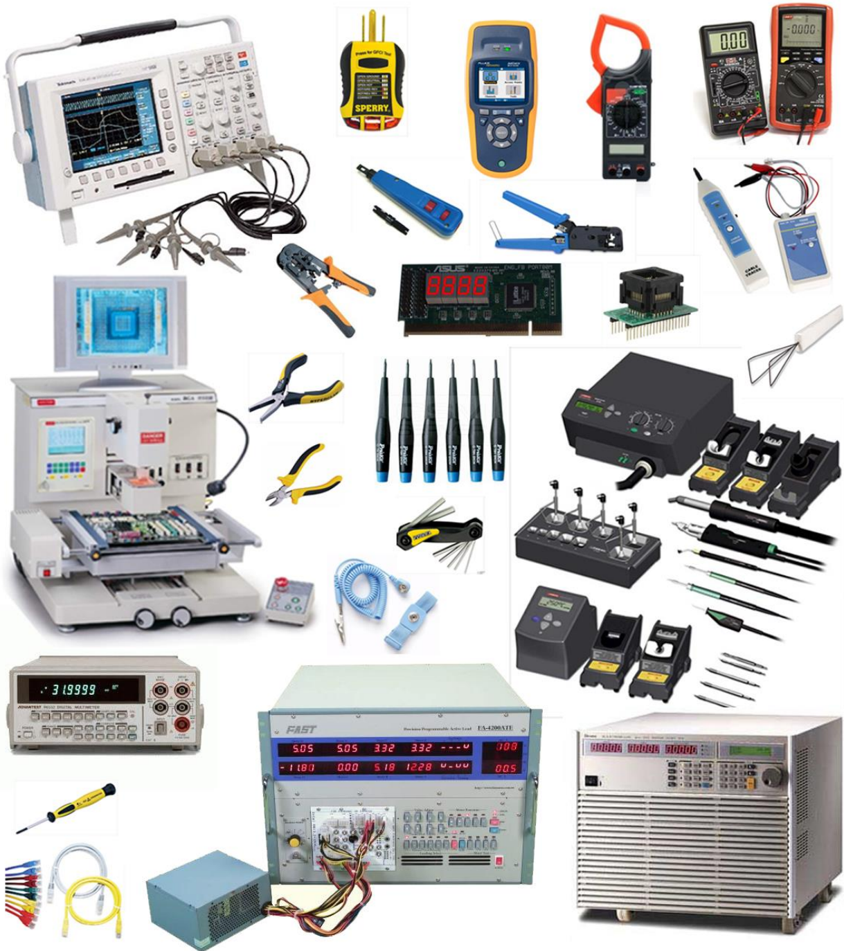
Donanım Teknisyeni cihazları

Birçok BT uzmanı, düşük deneyime ve eğitim gereksinimlerine bağlı olarak donanım teknisyenleri olarak kariyerine başlarlar. Bu alanda belirli bir tecrübe edinen kişiler, daha sonra, yeni BT alanlarına ilgi duyabilirler. Ağ yöneticisi, veritabanı uzmanı veya diğer BT mesleklerine ilgi duyan kişiler bu alanlarda eğitim alarak kendilerini geliştirebilirler ve çalışma alanlarını değiştirebilirler. Bir diğer alanında yükselme ise kişiler bu alanda çalışmaya devam ederek edindikleri deneyimler sonucunda yardımcı masası teknisyeni yöneticisi olabilirler.